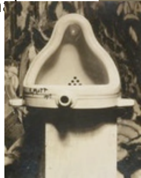
Fountain, Marcel Duchamp, 1917